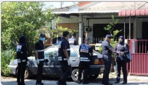
【华裔夫妇毙命客厅案】嫌犯在云顶落网 警在垃圾桶寻获斧头 8小时前 社会