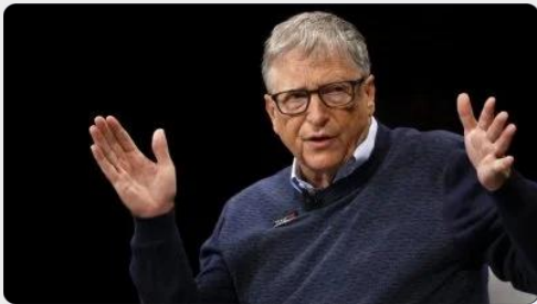
比尔盖茨又买地了 成为美国头号私人农田主 8小时前 国际