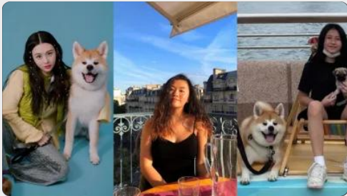
邱淑贞小女儿近照罕曝光 3姊妹各有各的美 9小时前 娱乐